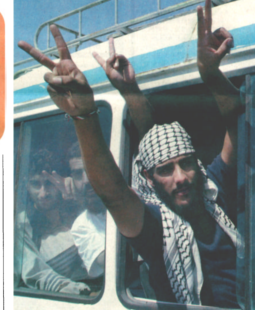
以色列释放部分巴勒斯坦人 6月3日，被以色列释放的巴勒斯坦人抵达约旦河西岸希伯伦的以军检查站。以色列当天开始释放其关押的大约100名巴勒斯坦人，以作为促进执行中东和平“路线图”计划的一项善意措施。（新华社）

“和平路线图”计划将分为三个阶段——第一阶段，2003年5月之前，以巴双方实现停火；巴方将积极打击恐怖活动，进行全面的政治改革，以方则应撤离2000年9月28日以后占领的巴方领土，冻结定居点的建设，采取一切必要措施使巴勒斯坦人的生活恢复正常。第二阶段，从今年6月到12月，重点是建立一个有临时边界和主权象征的巴勒斯坦国，中东问题四方将为此召开国际会议。第三阶段，从2004年到2005年，以巴双方将开始就最终地位进行谈判，并在2005年达成协议，最终结束双方的冲突。中东问题四方将就此召开第二次国际会议。 4日，美国总统布什、以色列总理沙龙、巴勒斯坦总理阿巴斯在“亚喀巴”这座“障碍之城”磋商巴以和谈大计，为世界和平扫除半个多世纪的“障碍”。 阿拉伯国家中只有约旦和埃及已经与以色列实现关系正常化，所以，从以色列边境城市埃拉特到亚喀巴只需办理过关手续，而不必申请签证。 没有随着大规模战争结束而消失。美国总统布什原本打算召集巴以总理及其他阿拉伯国家首脑在埃及旅游胜地沙姆沙伊赫举行峰会，大家一起谈。结果，沙龙不愿去埃及，阿拉伯国家首脑也不愿与沙龙握手，这才另选一处作为美以巴三方会谈的地点。 出乎意料，至少到2日为止，亚喀巴街头的行人对三方峰会还是表现得