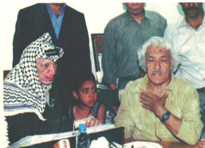
6月3日，巴勒斯坦民族权力机构主席阿拉法特（左）在约旦河西岸城市拉姆安拉接见刚刚释放的巴勒斯坦老人艾哈迈德·阿布·苏卡尔。苏卡尔现年70岁，他是被以色列关押时间最长的巴勒斯坦人。以色列有关部门3日上午释放了90名巴勒斯坦人，为在约旦港口城市亚喀巴举行的以巴美三方会晤营造良好气氛。

美以巴三方峰会选在一个名叫“障碍之城”的地方举行，纯属巧合。而眼下的巴以和谈却不得不说是“障碍重重”。尽管美国总统布什投入了上任以来的最大热情，尽管“路线图”计划为巴以停止冲突、重开和谈划定具体路线，但是，耶路撒冷归属、巴勒斯坦难民回归权、犹太人定居点等巴以和平道路上最根本、最顽固的障碍原地不动，和平之路能否走通？ 其实，选在亚喀巴举行峰会本身也反映了阿拉伯国家与以色列之间的隔 十分冷漠。有人甚至没听说峰会这回事。1948年第一次中东战争期间逃难到约旦的巴勒斯坦人穆罕默德·阿德里认为：“他们只是谈谈，不会有什么行动……问题还是老问题：大家要同一块土地。” 与此相对，2日这一天，亚喀巴各大宾馆已经住满从世界各地蜂拥而至的记者。记得在埃拉特检查站办理过关手续时，问办事员今天有多少人从以色列回约旦，她没有提供数字，而是高声回答：“全是记者！”（周轶君）