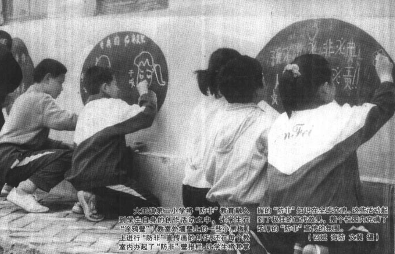
大里镇第三小学将“防非”教育融入到学生自身的创作活动中。让学生在“涂鸦壁”(教室外墙壁上的一些小黑板)上进行“防非”宣传画的创作,还在每个教室内办起了“防非”黑板报,让学生将其掌握的“防非”知识在全班交流,这些活动起到了较好的宣传效果。整个校园内充满了浓厚的“防非”宣传的氛围。